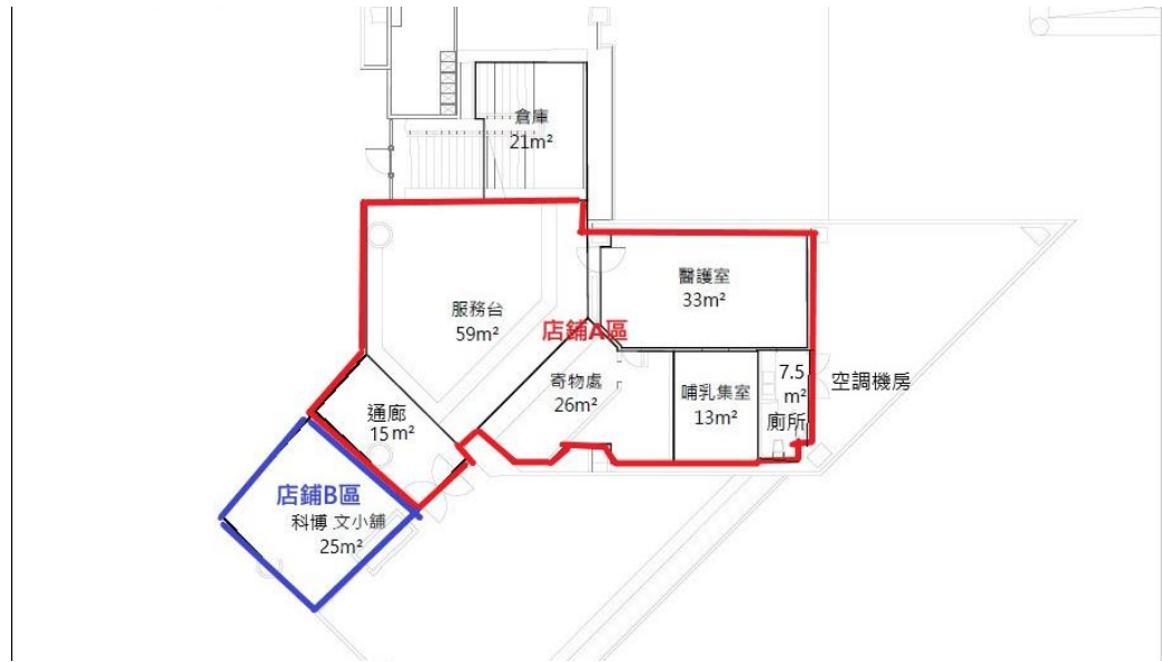
圖 1 租賃標的及範圍